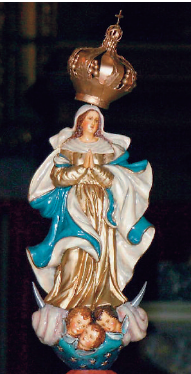
▲ Ntra. Sra. de los Treinta y Tres, patrona de Uruguay