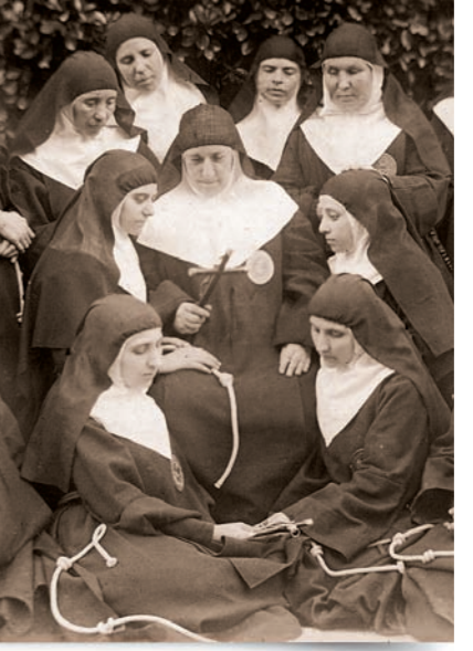
Detalle de la fotografía conocida como «Lección del Crucifijo», 16 de julio de 1892.